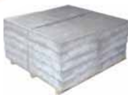
piastre lisce per camminamenti da spiaggia