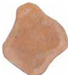
piastra per percorso giapponese