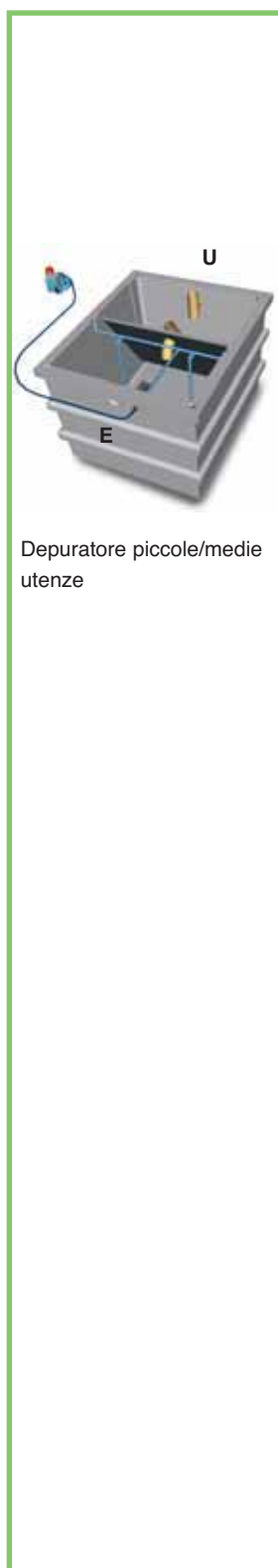
Depuratore piccole/medie utenze