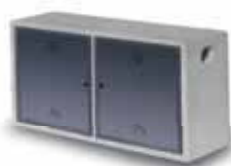
Cassetta gas FARM doppia