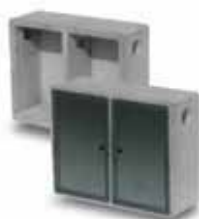
Cassetta gas HOME doppia