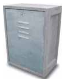
Cassetta gas EASY

in cls gettato per abitazioni con porta zincata compresa nel prezzo