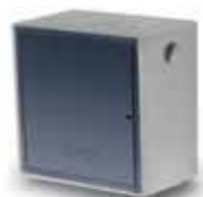
Cassetta gas FARM singola