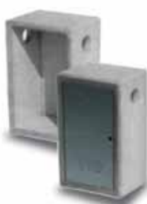
Cassetta gas HOME singola

in cls gettato per abitazioni con porta zincata/inox non compresa nel prezzo