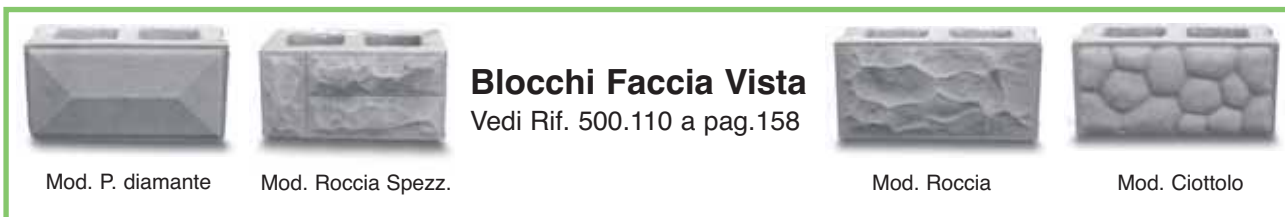
Mod. P. diamante