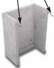
Bocca di lupo in cemento