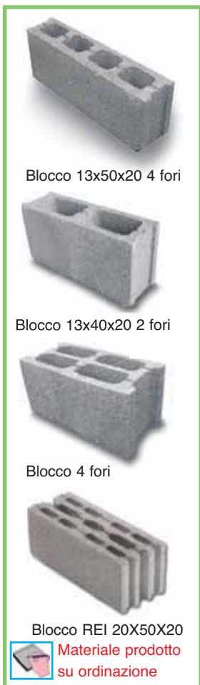
Blocco 13x50x20 4 fori