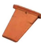
Minitec Sottocolmo Diritto Lunghezza: ~ 200 Larghezza: ~ 120/80 Peso: ~ 0,7 kg