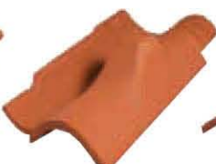
Unicoppo Extra Fermaneve Lunghezza: ~ 450 Larghezza: ~ 200 Peso: ~ 3 kg