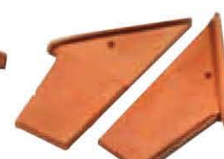
Minitec 45° Bifacciale Sottocolmo Sinistro/Destro Lunghezza: ~ 280/130 Larghezza: ~ 210/80 Peso: ~ 0,8 kg