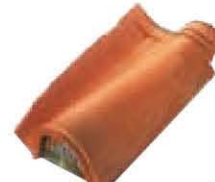
Aeratore per Unicoppo Extra con rete metallica Lunghezza: ~ 450 Larghezza: ~ 260 Peso: ~ 4,3 kg