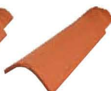
Mezzo Unicoppo Extra Peso: ~ 2 kg