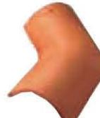
Due Vie per Coppessa Lunghezza: ~ 440 Larghezza: ~ 230/180 Peso: ~ 3 kg