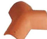
Tre Vie per Coppessa Lunghezza: ~ 450 Larghezza: ~ 410 Peso: ~ 4,8 kg