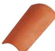
Finale per Coppessa Lunghezza: ~ 450 Larghezza: ~ 180/145 Peso: ~ 2,2 kg