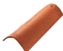
Coppessa T/52 con foro Lunghezza: ~ 550 Larghezza: ~ 230/180 Peso: ~ 3 kg