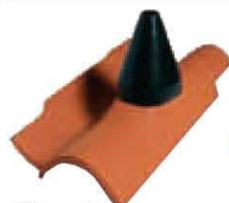
Unicoppo Extra per antenna con cappuccio Lunghezza: ~ 450 Larghezza: ~ 190 Peso: ~ 2,8 kg