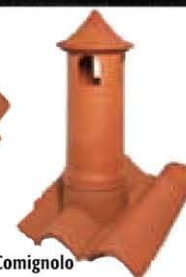
Comignolo per Unicoppo Extra Ø 150 Peso: ~ 11,8 kg